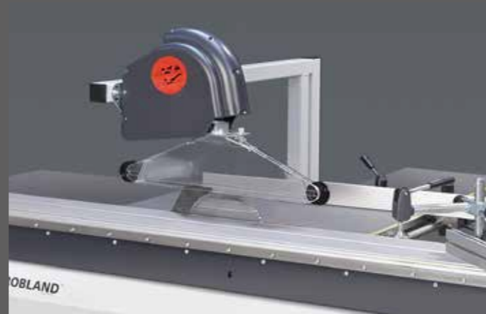
OPTIE Beveiliging op potence