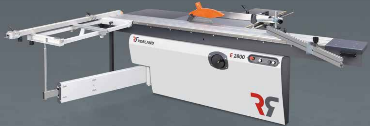
Machine met opties Machine avec options Machine with several options Maschine mit verschiedene Optionen