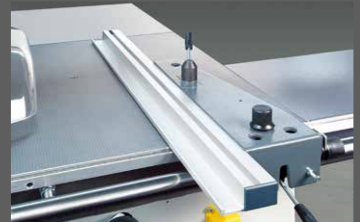
Parallelaanslag met micrometrische fijnstelling, omklapbaar voor smalle snedes met schuingesteld zaagblad.