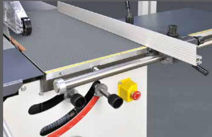
Eenvoudige afstelling van het voorritsaggregaat