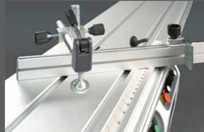
De 2x 45° schuinstelbare verstekgeleiding met aanslag is uitgerust met een zware houtklem.