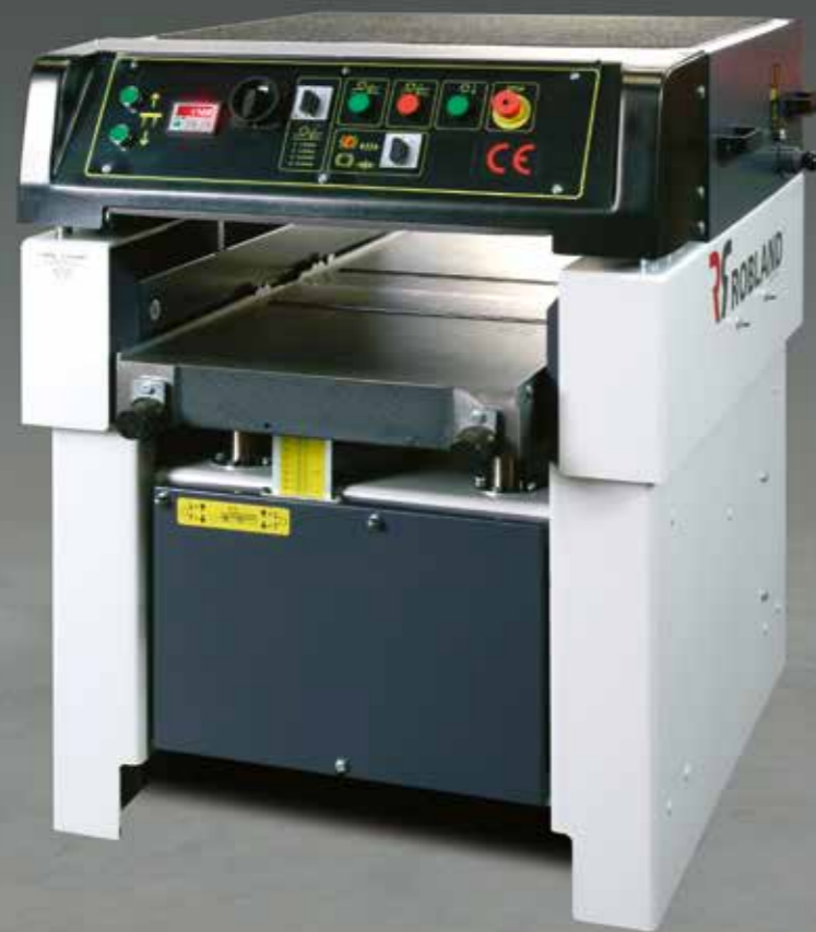
Machine afgebeeld met opties Machine avec plusieurs options Maschine mit verschiedene Optionen Machine with several options