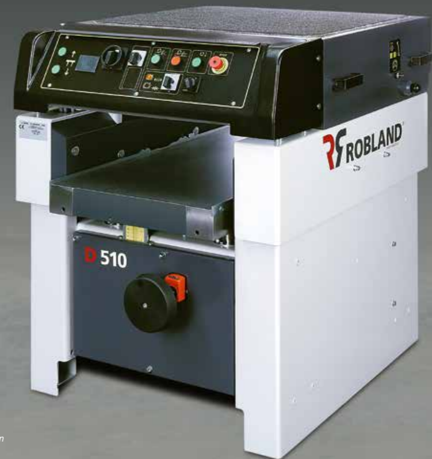
Machine afgebeeld met opties Machine avec plusieurs options Maschine mit verschiedene Optionen Machine with several options